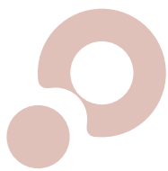
Nagasaki Design Award 2015

審査講評 ■ 長崎の特産品である落花生を使って昔から作られていたという「落花生とうふ」を、デザインの力で現代の顔つきに仕立てたもの。素朴な雰囲気は損なわない、ほどよいお洒落感とおいしそうに見える色使いが、商品のもともと持っている魅力をうまく引き出して伝えている。落花生とうふを食べたことのない若い層にも届くコミュニケーション力を持ち、地域のお土産パッケージの好例と言える。(左合ひとみ)