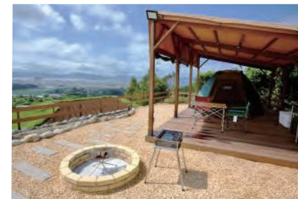
キャンプ施設「つばさの丘」

佐世保市で公務員として働いていた頃からキャンプが好きで、週末はいつもキャンプに出掛けていました。キャンプの魅力は「何もしない」贅沢。家にいると何かと用事がありますが、キャンプ場に来るといんなものから開放されて心身が自由になり、リフレッシュできます。