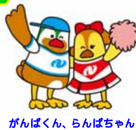
がんばくん、らんばちゃん