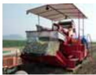
大型農機具の一例