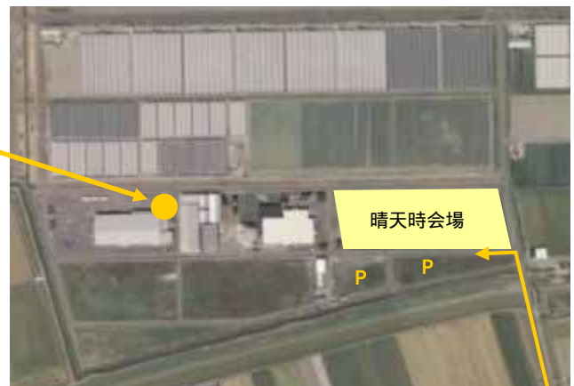
晴天時も雨天時も駐車場は十分用意しています。