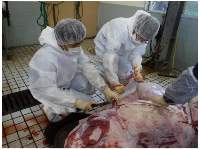
疾病診断の基本となる病性解剖