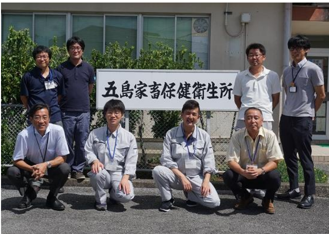
皆さんお世話になりました！