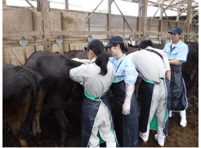
胎仔の状態はどうか。。