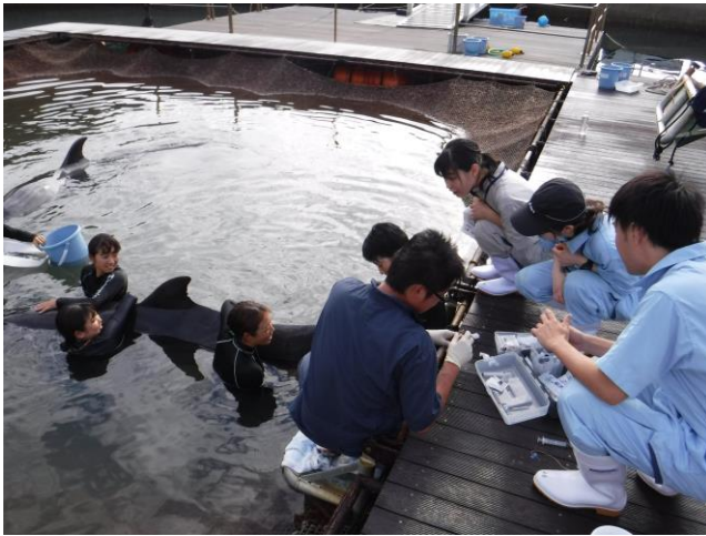
イルカの健康診断も体験