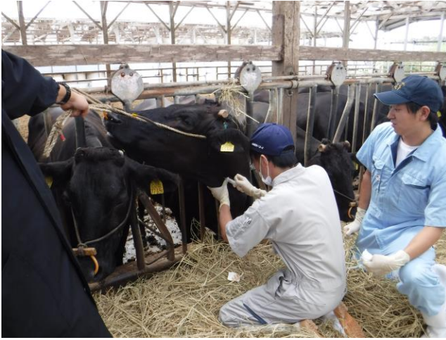
チクツとしますよ～