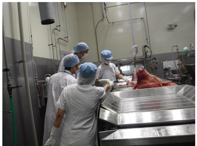
食肉センターも見学