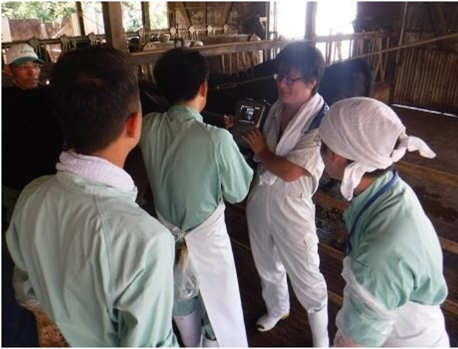
受胎をエコーでチェック