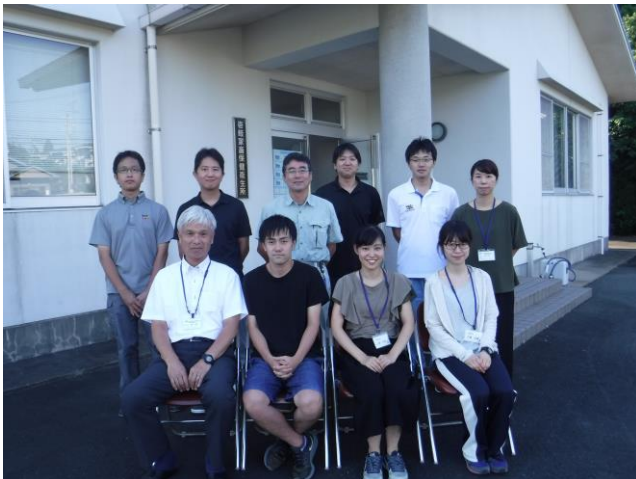
吉岐家保のみんなと記念撮影