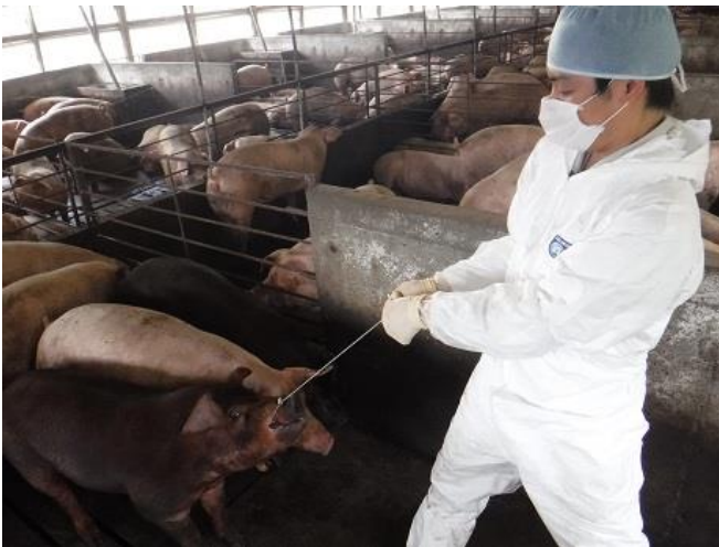
しっかり保定します