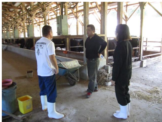
コミュニケーションって大事だなあ