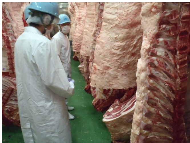
食肉衛生検査所も見学しました