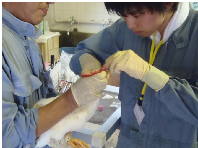
気管に綿棒を入れるのって難しいな・・・