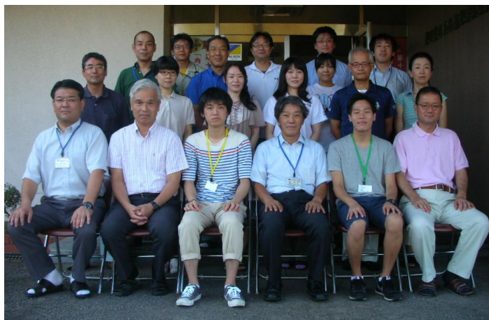
中央家保のみんなと記念撮影