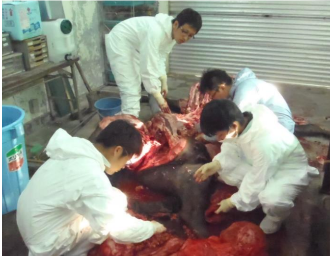
基本の病性解剖も体験