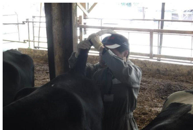
どこから採るのかなあ～尾静脈編