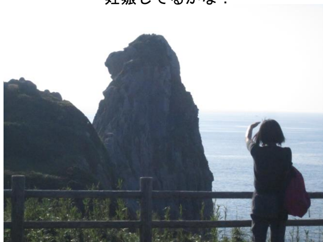
おさるさんとツーショット