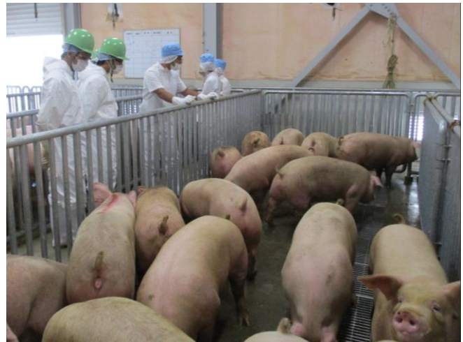
獣医師っていろんな仕事があるなあ