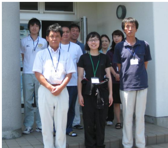
みんなでパシャリ。真ん中が私です！