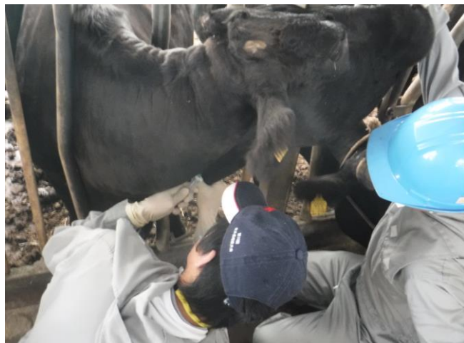
どこから採るのかなあ～頸静脈編