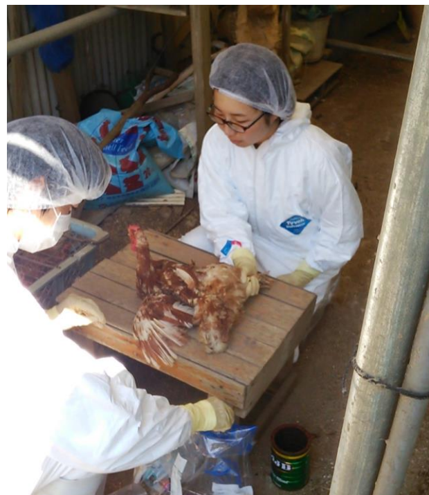
鶏の血管って細い・・・