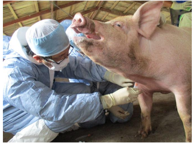
豚の血管ってみえない・・・！！