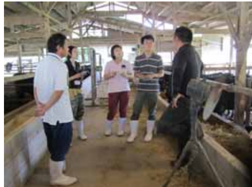
肥育農家と意見交換