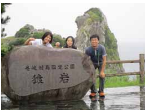
壱岐の名所「猿岩」をバックに