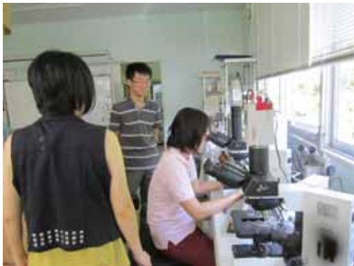
血液塗抹標本の観察