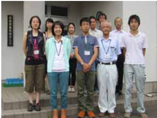
研修生3名と壱岐家保の前で集合写真