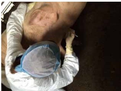
豚のステージ採血