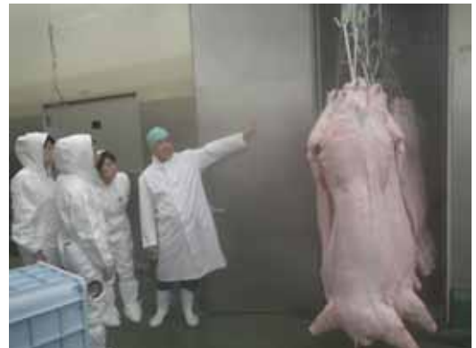
と畜場視察(保健所研修)