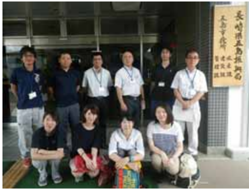
研修生3名と五島振興局の前で集合写真