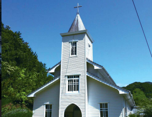
④中ノ浦教会 / 堂内の構造は三廊式で、折り上げ天井になっている。梅の花を模した瓦葺が特徴的。