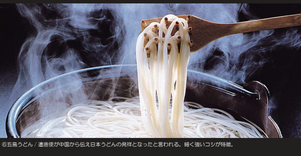
⑥五島うどん / 運使使が中国から伝え日本うどんの発祥となったと言われる。細く強いコシが特徴。