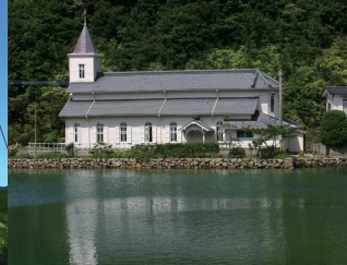
⑤水辺に佇む中ノ浦教会 / コバルトブルーの水面に映る教会の白さは昔段の姿とはまた違う一面を見せる。