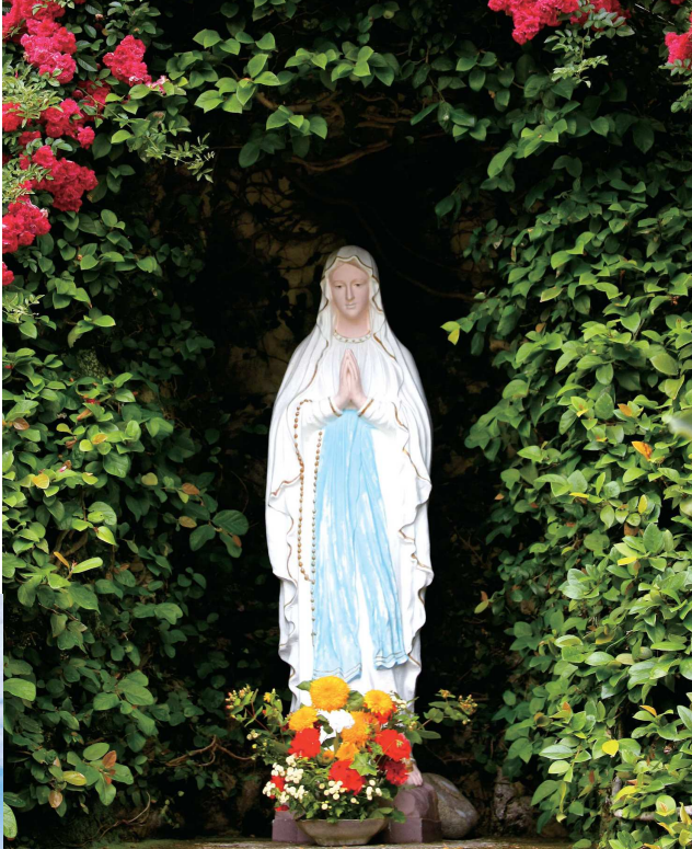
②中ノ浦教会の聖母マリア像 / 外海のキリシタン弾圧から逃れ、この地にたどり着いた祖先が建てた。現在の教会は、大正14年竣工。5月から6月になると真っ赤なバラのアーチに包まれる。