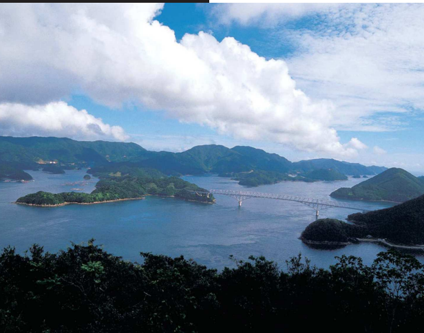
③龍観山展望台より若松大橋（若松地区） / 中通島と若松島をつなぐ若松大橋。渦潮や海の色、橋の下を船が行き交うなどドラマチックな風景に出会える。