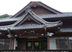
①福楽寺 / 7世紀頃に制作されたわが国でも数少ない貴重な如来像を所有、国の重要文化財に指定されている。

Narao Port, which is considered the southern gate of Nakadori Island, will serve as the starting point of this course. Guests will leave the port, cross Wakamatsu Bridge, and visit Ryukanzan Park, from which the dynamic scenery of the Wakamatsu Strait can be enjoyed. From there guests will move northward to Nakanoura Church which is famous for its beautiful reflection in a nearby body of water. After that the course continues toward the eastern side of Nakadori Island to see the expanse of the Goto Sea. At a crossroads on the way up Mt. Sannouzan, there are the remains of the Former Arakawa Elementary School with Koukou Falls in the background. The final stop is the Aokata area which was the main town in Old Kamigoto and has many great ryokan (Japanese-style lodging), bed and breakfasts, and restaurants.