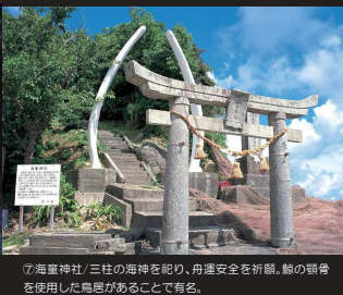
⑦海童神社 / 三柱の海神を祀り、舟運安全を祈願。腰の額骨を使用した鳥居があることで有名。