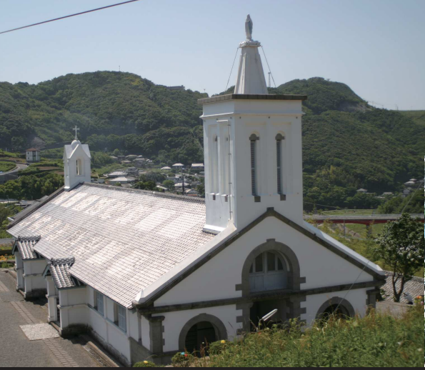
聖公会堂/1882年ト・ロ神父が私財を投じて竣工。長崎の教会群とキリスト教関連遺産の一つ。