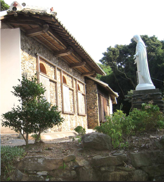
②大野教会堂/2008年に国の重要文化財に指定。長崎の教会群とキリスト教関連遺産の一つでもある。

⑥Gon'aji (Nagasaki horse mackerel /Gon'aji is a type of horse mackerel that lives in the waters around Goto. It makes superb sashimi.