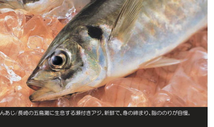
九あじ/長崎の五島灘に生息する瀬付きアジ。新鮮で、身の締まり、脂のりが自慢。

②Ono Church/This church was designated by the Japanese government as an Important Cultural Property in 2008. It also belongs to the list of "Churches and Christian Sites in Nagasaki".