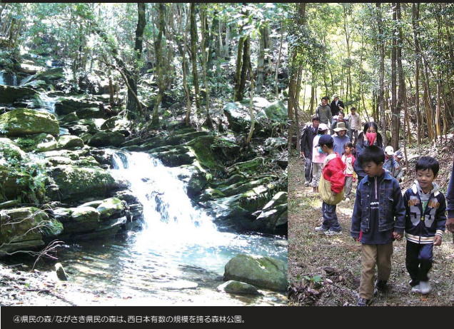
④県民の森/ながさき県民の森は、西日本有数の規模を誇る森林公園。

③Shitsu Church/This church was built by Father de Rotz on his own property in 1882 and is part of the heritage list of "Churches and Christian Sites in Nagasaki".