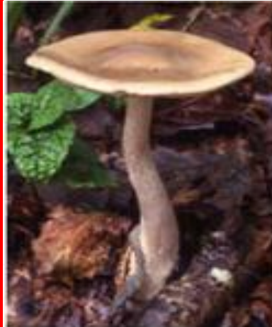
クサウラベニタケ

【中毒症状】 クサウラベニタケは食後20分～1時間程度で嘔吐、下痢、腹痛など消化器系の中毒を起こす。唾液の分泌、瞳孔の収縮、発汗などの症状も現れる。