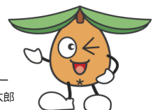
長崎県食育キャラクター びわ太郎

この紙面への掲載の参考とさせていただきますので、県内各地域での食育に関する取り組み、お知らせをお待ちしております。お気軽に情報をお寄せ下さい。