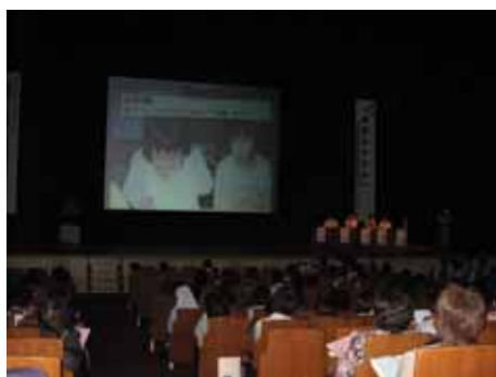
パネルディスカッション