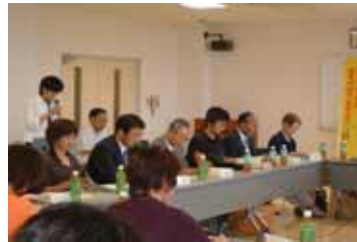
県南地域ネットワーク会議