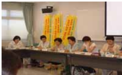
県北地域ネットワーク会議