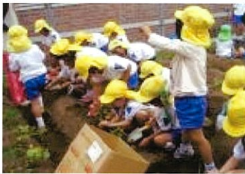
じゃがいもの収穫