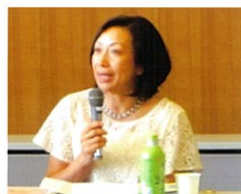
活動報告や意見を発表する様子