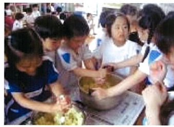
ポテトサラダ作り