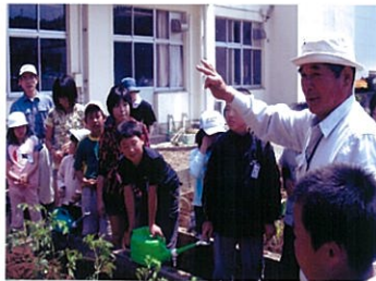
夏野菜の植え付け