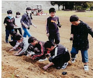
とうもろこしの植え付け