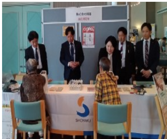
R7.11.13 長崎県民会議総会測定ブース