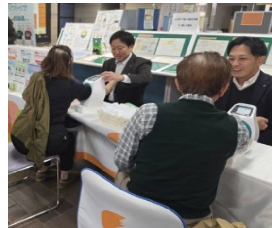
R7.11.29 長与町 健康イベント