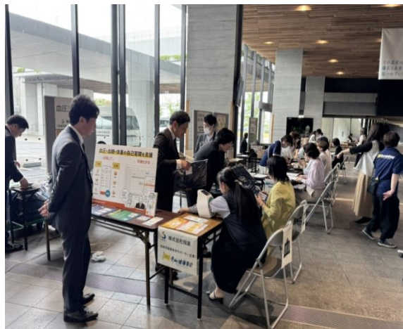
R7.6.2 長崎県庁 禁煙イベント