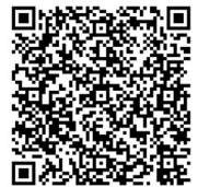
県ホームページ QR コード

今回、その利活用方法に関する民間事業者の意向や提案を広く募集するためにサウンディング型市場調査を実施します。詳しくは、県ホームページ(長崎県都市政策課内)をご確認下さい。なお、調査内容に関する説明会を令和8年2月25日に行いますので、下記問い合わせ先に申込みください。