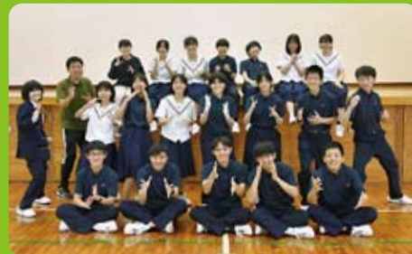
楽らくスポーツ部