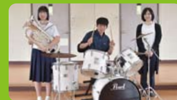
総合文化部(吹奏楽)