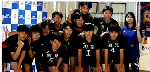
🏐 バレーボール部〈男子〉