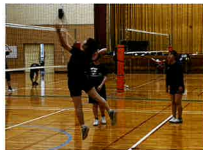
🏐 バレーボール部〈女子〉