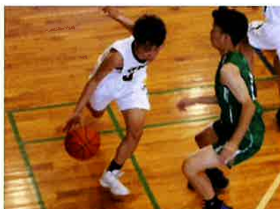
🏀 バスケットボール部〈男子〉