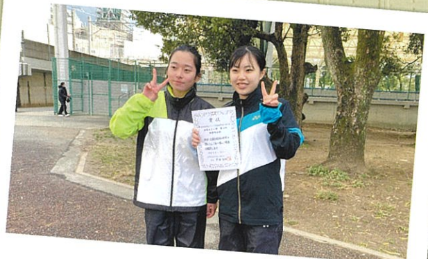
ソフトテニス部（女子）