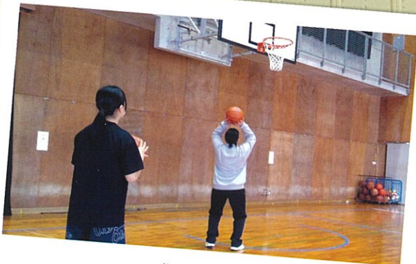
バスケットボール部（女子）