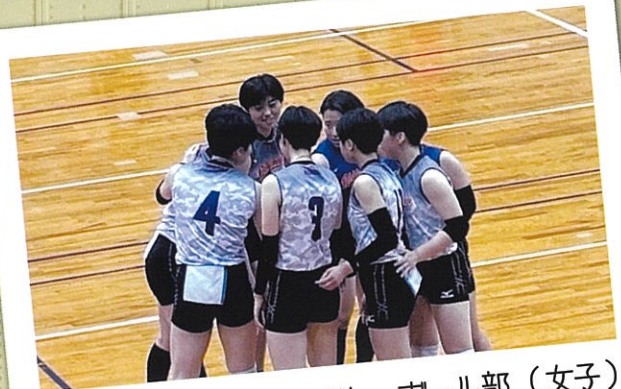
バレーボール部（女子）