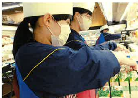
● インターンシップ

様々な課題に対して自分の意見を、 多角的・総合的 に考え、自分の意見を持ち、他者と協力しながら解決していく力を養います。