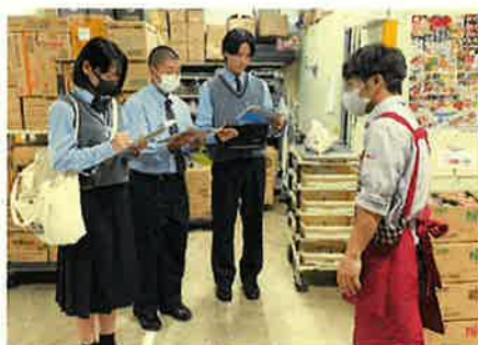
● 職業インタビュー