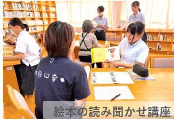
絵本の読み聞かせ講座