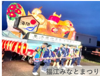
福江みなとまつり