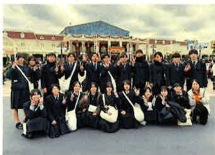
● キャリア研修（修学旅行）