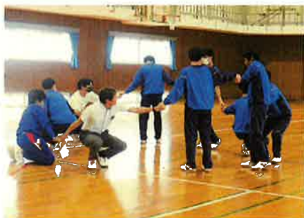
● 鶴南五島分校との交流会