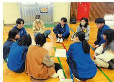
● 日本語学校等の交流会