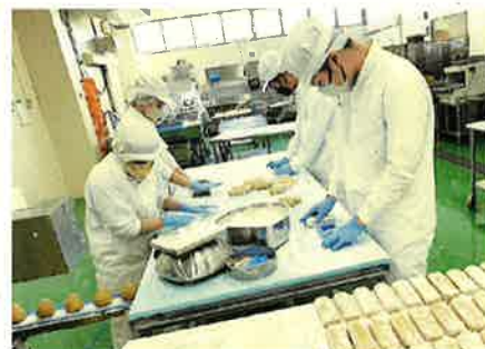
● 長期就労体験（デュアル・システム）は、地域・生活系列のみ実施します。