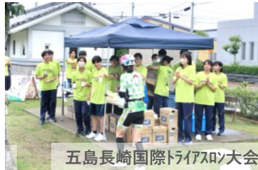
五島長崎国際トライアスロン大会