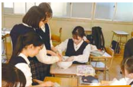
2年 グループでの探究活動