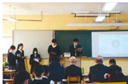
2年 ESDプレゼン発表会