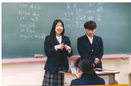
1年 国文科生徒による韓国語講座