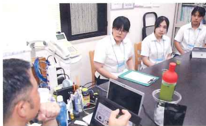
フィールドワーク