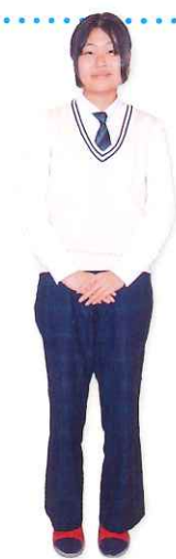
Message from a senior student

私は中学生のときから就職したいと思い、就職に有利な資格をたくさん取ることができる商業科に入りました。入学したての頃は初めての商業科で慣れないことばかりでしたが、先生方の分かりやすい授業やご指導のおかげで、全商ビジネス計算実務検定1級をはじめ、7つの検定に合格することができました。今も上位の検定の取得のために勉強に励んでいます。勉強はきついです、分らないところがあったら友達同士で教え合うなどして助け合いながら学校生活を送っています。皆さん、松浦高校で楽しく充実した学校生活を送りませんか。