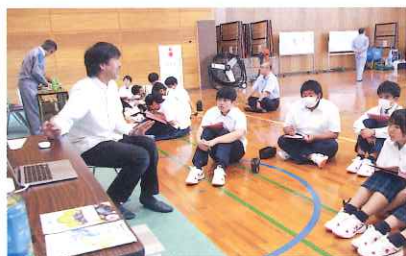
松浦未来発見講座