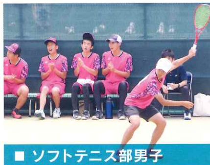
■ ソフトテニス部男子

R4 全国選抜大会団体 5位 R4 全九州大会個人 3位 R4 インターハイ団体 5位 R5 インターハイ個人 3位 団体 5位 R5 全国選抜大会 男子個人 3位 R6 インターハイ団体 ベスト16 R6 全国選手権大会 男子個人 ベスト8