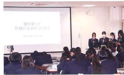
課題研究構想発表会