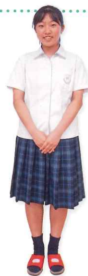
Message from a senior student

私が所属しているアカデミーコースでは、お互いに高め合いながら、学習に集中しやすい雰囲気があります。また、団結力があり、行事にも積極的に取り組むことができますので、学校生活を送りやすいと感じています。地域科学科では、授業や課題で分からないところがあっても、先生方が分かりやすく丁寧に教えてくださいます。「まっナビ・プロジェクト」では、課題や自分のやりたいことを見つけて、解決に向けたフィールドワークや活動のプレゼンをする機会が多くなるので、コミュニケーション力、プレゼンテーション力を身につけることができます。自分のやりたいことをしたい人、勉強に力を入れたい人におすすめです。ぜひ、明るく楽しい学校生活を松浦高校で送ってみませんか。