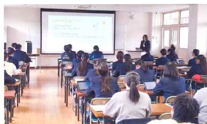
インターンシップ報告会