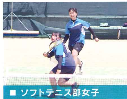
■ ソフトテニス部女子

R4 県高総体団体 ベスト16 R6 佐世保地区春季選手権大会 個人ベスト32 R6 佐世保地区新人大会 個人ベスト16