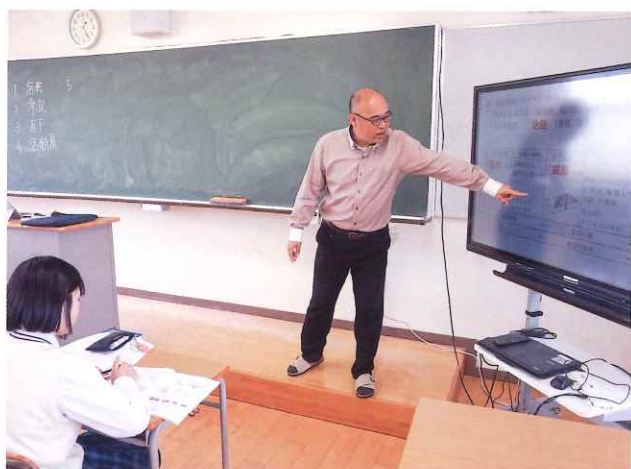
ICTを活用した効率的な授業により、基礎学力の養成を図ります。