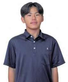
学校指定ポロシャツ(紺・白) も着用できます。