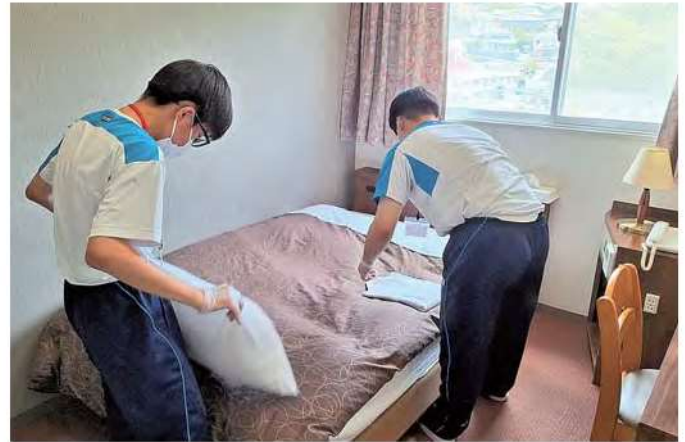
インターンシップ(2年)