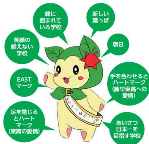
マスコットキャラクター 東葉（あずは）ちゃん

令和7年4月現在、 1・2年生2学級、3年生3学級の計7学級 生徒数は 男子80名 女子47名 計127名 です。