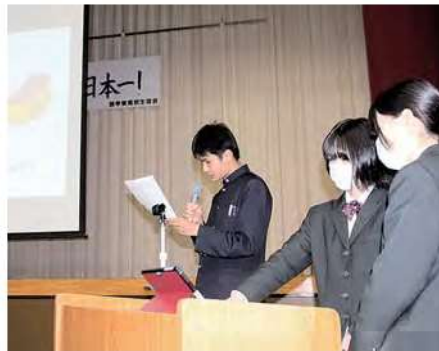
ふるさと探究実践発表会