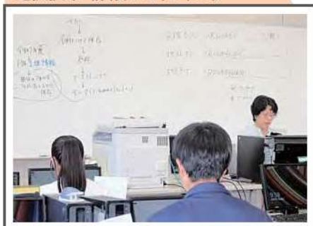
選択授業 情報処理(3年生)