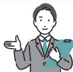
特別支援教育コーディネーター (教諭)