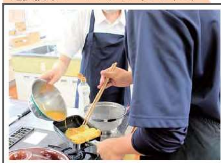
選択授業 フードデザイン(2・3年生)