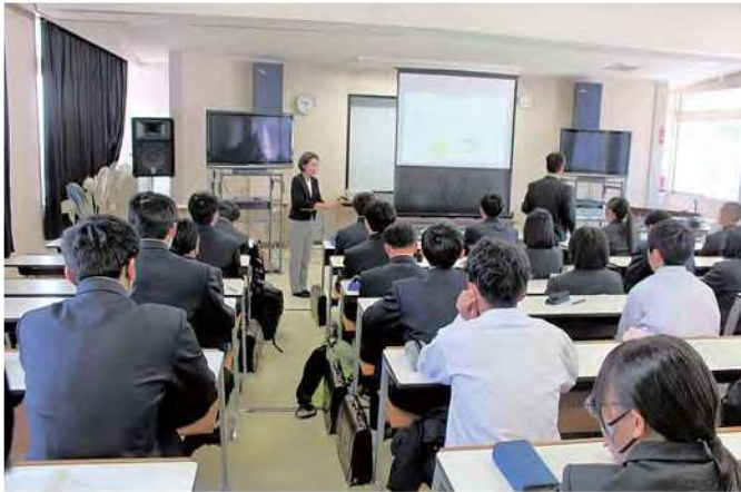
新入生研修「新風」(4月)