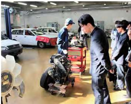
上級学校見学会(1年)