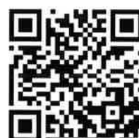
▲ながさきピース文化祭2025HP