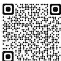
▲長崎県文化振興・世界遺産課HP