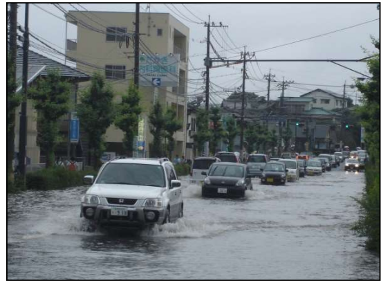
県道佐世保日野松浦線 冠水状況 (H20.6.19)

このため県では浸水被害解消を目的に平成3年度から国の補助を受け河川改修工事に着手し、令和6年度までに河口部の水門1基、橋梁8橋、及び鷺田尾橋上流までの1,840m区間の築堤・護岸が完成し、河川改修事業が完了しました。