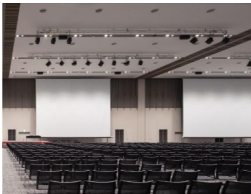
出島メッセ長崎(2階コンベンションホール)