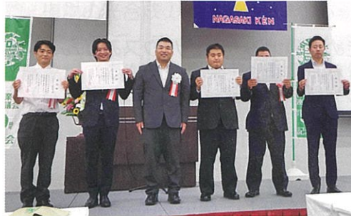
実行委員長賞を受賞した いさはや4Hクラブ諫早支部（写真左端）