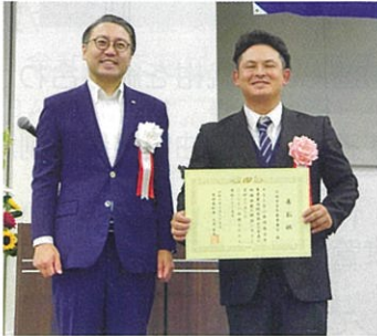
知事賞を受賞した 大村市青年農業者会（写真右）

令和6年7月25日、出島メッセ長崎（長崎市）で開催された「長崎県青年農業者連絡協議会50周年記念大会」において、これまでの20年間で、九州や全国の発表大会において功績を残した青年農業者組織が表彰されました。県央地区からは、大村市青年農業者会が長崎県知事賞、いさはや4Hクラブ諫早支部が実行委員長賞を受賞しました。受賞者を代表して大村市青年農業者会が活動の成果を発表し、「地域の核となる担い手育成、農業の魅力発信、長崎県の農業発展を目指して今後も活動していきたい！」と未来に向けての抱負が語られました。