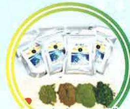
ともながハーブ [ハーブ製品]