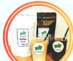
vector.coffee.roaster [オーガニックコーヒー]