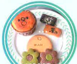
ALLIO [白砂糖不使用スイーツ]