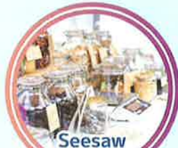
Seesaw ゼロウェイストショップ [オーガニックナッツ]