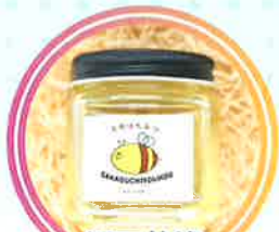
坂口養蜂 [国産天然蜂蜜]