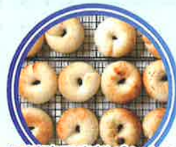
酒種酵母米粉パンと [無添加グルテンフリーパン][オーガニック弁当・焼菓子]