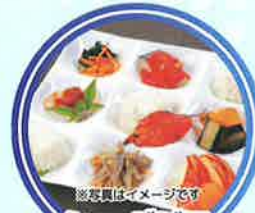
シエ・デジマ [ながさき健味ん弁当]