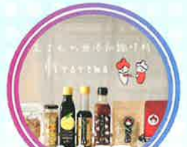
ヒトテマ [無添加調味料 他]