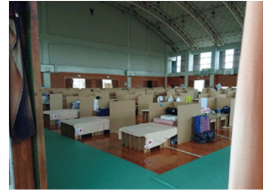
写真はイメージ