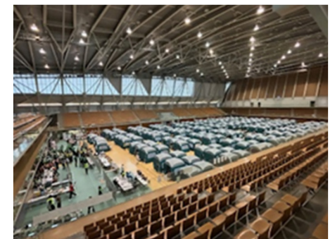
いしかわ総合スポーツセンター