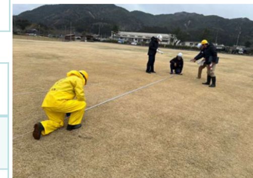
写真はイメージ