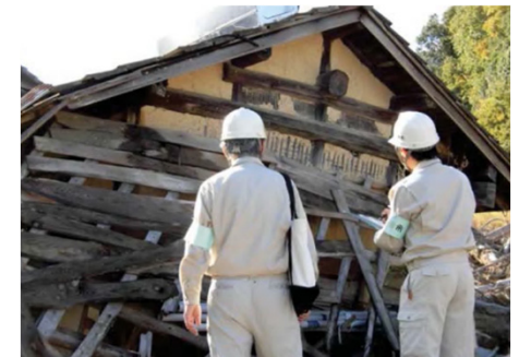
写真はイメージ