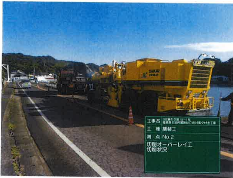
工事名 田原市交差点10-1号 橋本町仁徳町間新設2車道付橋交差点工事 工種 舗装工 測点 No.2 切削オーバーレイ工 切削状況