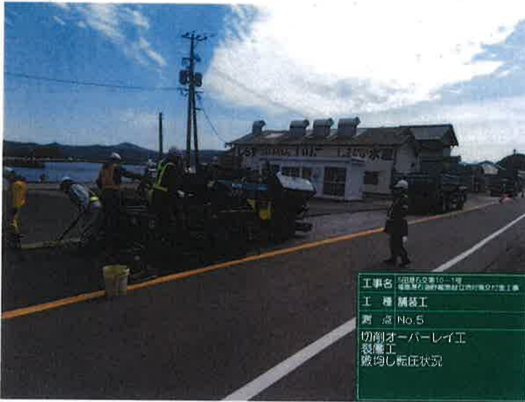
工事名 庄原町交差点10-1号 橋梁架設工事(橋脚部)の付帯工事 工種 舗装工 測点 No.5 切削オーバーレイ工 表層工 敷均し転圧状況