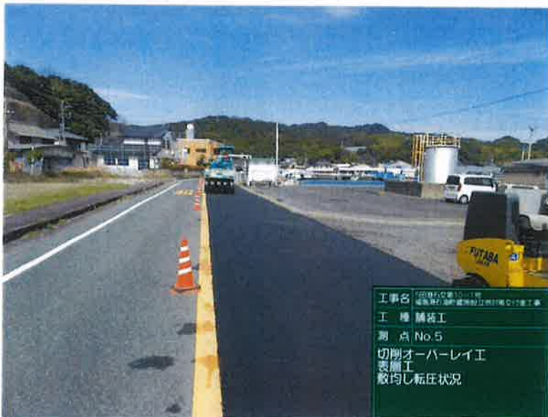
工事名 庄原町交差点10-1号 橋梁架設工事(橋脚部)の付帯工事 工種 舗装工 測点 No.5 切削オーバーレイ工 表層工 敷均し転圧状況