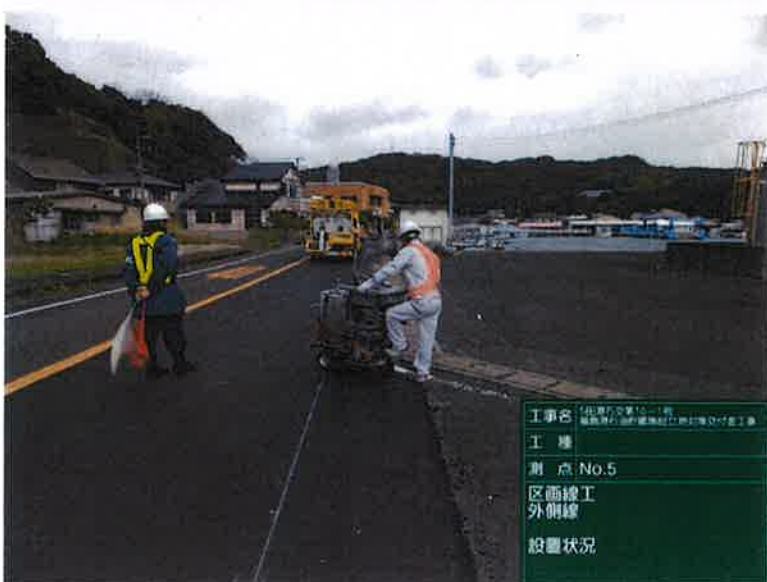
工種： 測点：No.5 区画線工 外側線 設置状況