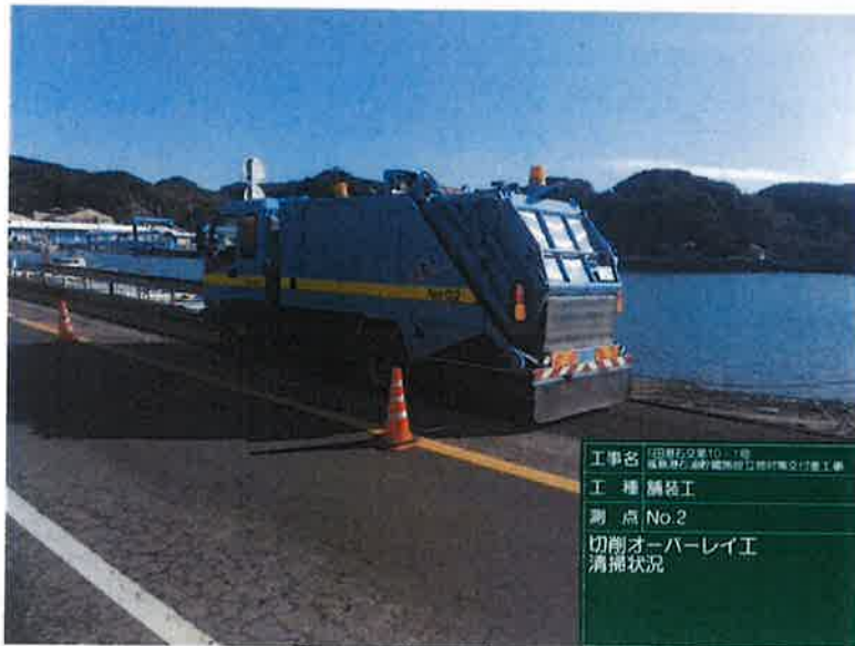
工事名 田原市交差点10-1号 橋本町仁徳町間新設2車道付橋交差点工事 工種 舗装工 測点 No.2 切削オーバーレイ工 清掃状況