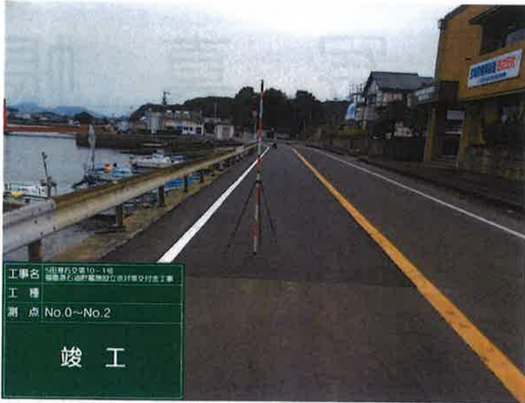
工事名 5田原右交差10-1線 福岡県石浜町藤原地区3期交付金工事 工種 測点 No.0~No.2 竣工