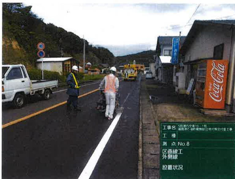
工種： 測点：No.8 区画線工 外側線 設置状況