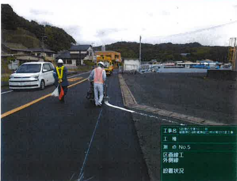
工種： 測点：No.5 区画線工 外側線 設置状況