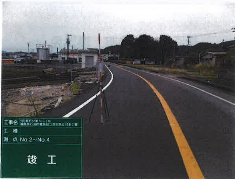
工事名 5田原右交差10-1線 福岡県石浜町藤原地区3期交付金工事 工種 測点 No.2~No.4 竣工