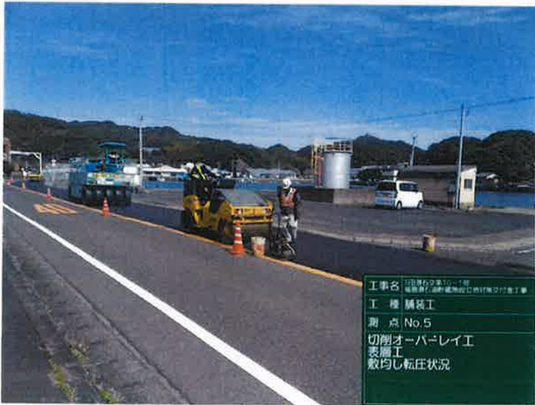
工事名 庄原町交差点10-1号 橋梁架設工事(橋脚部)の付帯工事 工種 舗装工 測点 No.5 切削オーバーレイ工 表層工 敷均し転圧状況