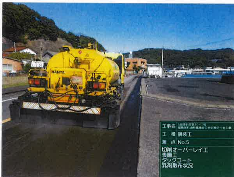
工事名 1号線右側第10-1号 道路維持・改善施設整備計画実施工事 工種 舗装工 測点 No.5 切削オーバーレイ工 表層工 タックコート 乳剤散布状況