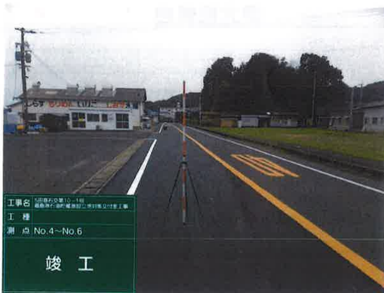
工事名 5田原右交差10-1線 福岡県石浜町藤原地区3期交付金工事 工種 測点 No.4~No.6 竣工