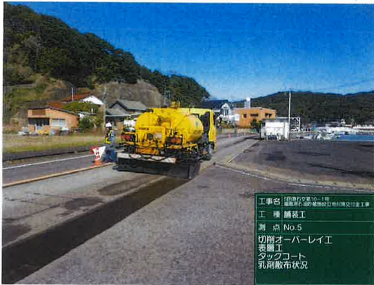
工事名 1号線右側第10-1号 道路維持・改善施設整備計画実施工事 工種 舗装工 測点 No.5 切削オーバーレイ工 表層工 タックコート 乳剤散布状況