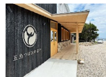
クラフトジンの蒸留所の開業