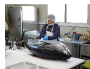
マグロ解体・加工場の設置

農水産・食品加工・情報通信・宿泊・飲食等、幅広い業種で活用いただいております。令和4年度までの6年間で約1,400名の雇用の場が創出されています。