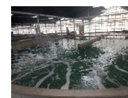
トラフグ陸上養殖施設の拡大