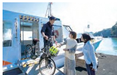
自転車をサイクルステーションでレンタルして一緒に船へ