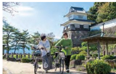
歴史ある城下町を自転車で散策