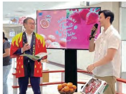
トークセッションの様子