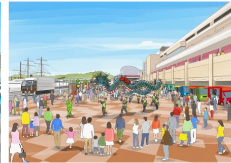
【にぎわい施設の内部】