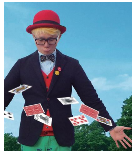
マジシャン・ドゥー