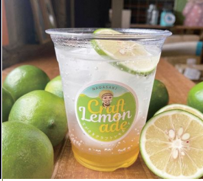
ボーダレスラウンジ