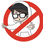
総合司会 MC NAOYA