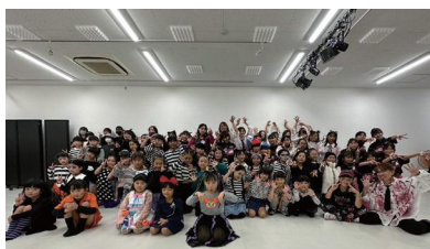
M.O.C.A Dance School