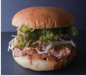
ブルームバーガー