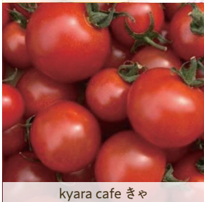
kyara cafe きゃ