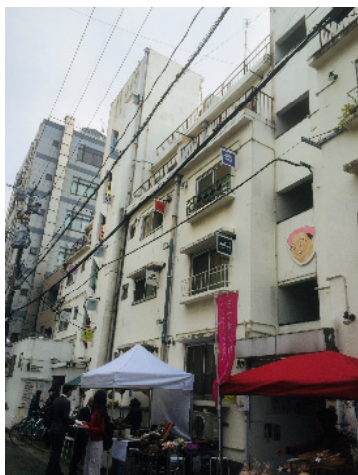
リノベーションミュージアム冷泉荘 (福岡市博多区)