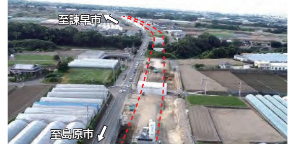
出平有明バイパス施工状況(島原市原口町付近)