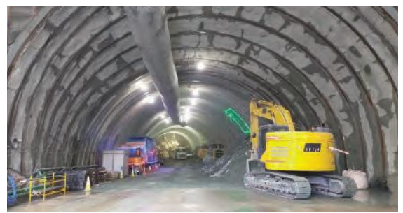
江川トンネル(仮称)施工状況

長崎市南部の渋滞緩和や交通の安全性向上などを目的として整備を進めており、現在は、新戸町と江川町で橋やトンネルの建設を進めています。