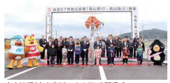
森山拡幅(森山東IC～森山西IC)開通式

令和4年5月には長野IC～栗面IC間、令和5年11月には森山拡幅のうち森山東IC～森山西IC間が開通しました。現在は、出平有明バイパスなどの整備を進めています。