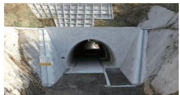
令和5年3月に貫通した坪トンネル