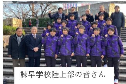
諫早学校陸上部の皆さん