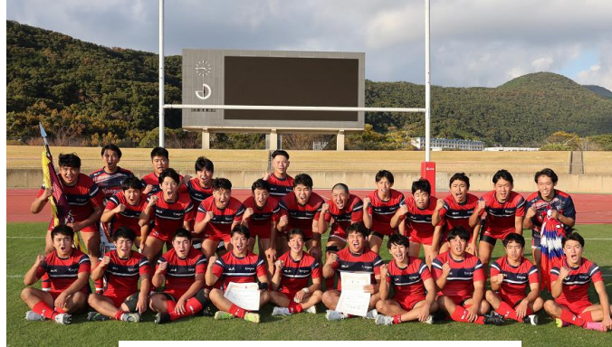
長崎南山高校ラグビー部の皆さん

長崎南山高校は、12月27日（水）から花園ラグビー場（東大阪市）で開幕する全国大会の1回戦で山梨学院高校と対戦します。皆様応援しましょう！！