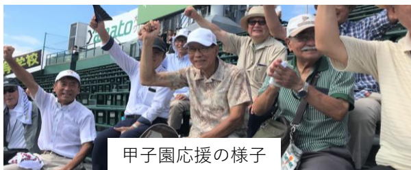
甲子園応援の様子

本年を振り返りますと、新幹線開業後の長崎県への観光客来客数が増加傾向にあること、G7長崎保健大臣会合の開催、長崎県初のプロバスケットボールチーム長崎ヴェルカのB1昇格、新長崎駅ビルの開業などが話題としてございました。