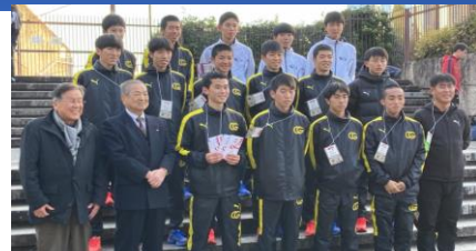
鎮西学院高等学校陸上部の皆さん

12月24日（日）同スタジアムにて大会が開催され、鎮西学院高等学校（男子）23位、諫早高校22位との結果になりました。選手並びに関係者の皆様、大変お疲れ様でした。また、県人会の皆様、応援ありがとうございます。来年もよろしくお願いたします！！