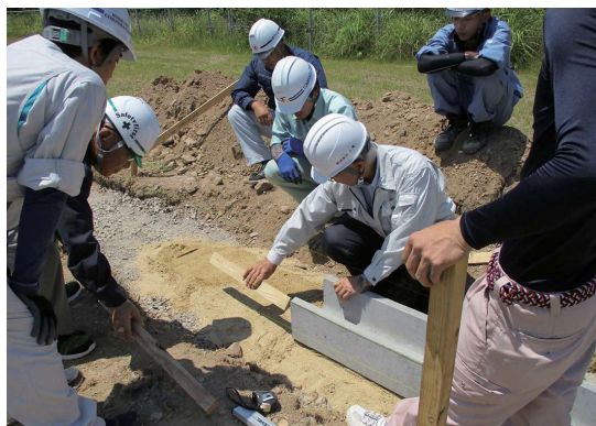
～土木施工管理基礎研修の様子～

令和元年度より、（公財）長崎県建設技術研究センターにおいて、建設業入職後の若手技術者を対象とした土木施工管理に関する短期研修として「土木施工管理基礎研修」を実施しています。