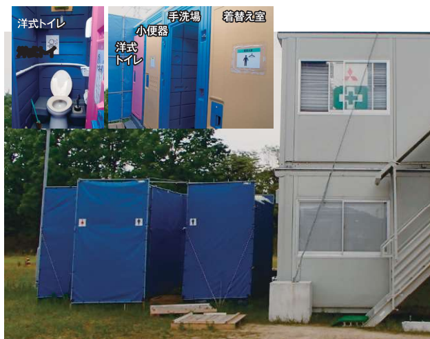
～「快適トイレ」の一例～