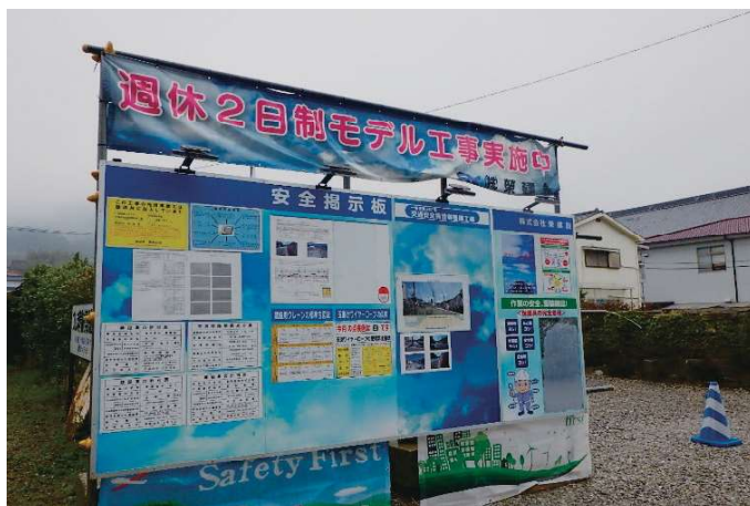
～「週休2日」取組の掲示状況～