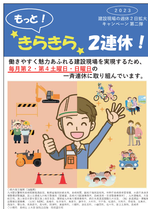
～「もっときらきら2連休」チラシ～