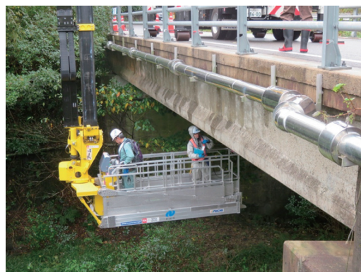
橋梁の定期点検状況

長崎県では、不具合が生じてからの補修ではなく、「 予防保全的手法 」を導入した効率的かつ計画的な維持補修を行うための維持管理計画を策定し、施設の延命化とライフサイクルコストの縮減を図り、次世代に社会資本を引き継ぎます。