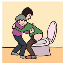
障がいや病気のある家族の入浴やトイレの介助をしている

©一般社団法人日本ケアラー連盟 / illustration : Izumi Shiga