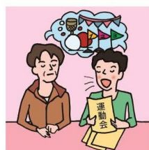
日本語が第一言語でない家族や障がいのある家族のために通訳をしている