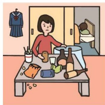
アルコール・薬物・ギャンブル問題を抱える家族に対応している