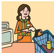
家計を支えるために労働をして、障がいや病気のある家族を助けている