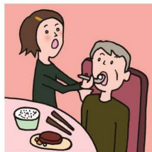
障がいや病気のある家族の身の回りの世話をしている