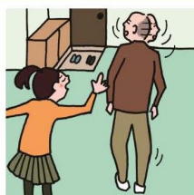
目を離せない家族の見守りや声かけなどの気づかいをしている