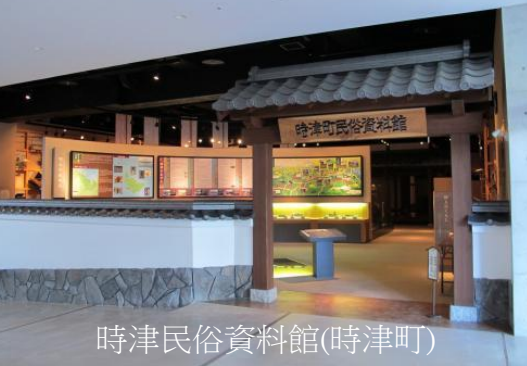
時津民俗資料館(時津町)