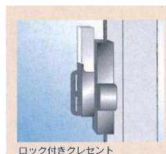
ロック付きクレセント