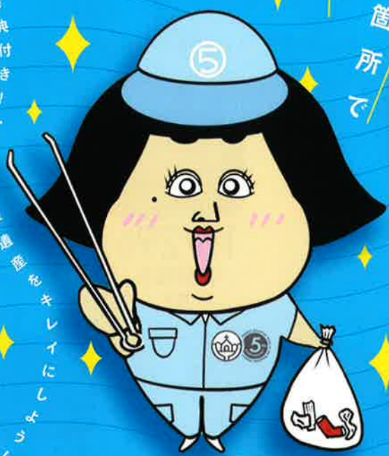
ナビゲートキャラクター [おたから まもる] @BUSON