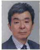
せいらい ゆういち 青来 有一

作家 元長崎原爆資料館長。長崎市役 所職中の 1995年に「ジェロニ モの十字架」で文学界新人賞を 受賞。主な著書に「聖水」(芥川 賞受賞)、「爆心」(谷崎潤一郎賞、 伊藤整文学賞受賞)など