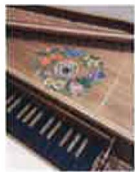
とうきょうげいじゆつだいがくこがくか 東京藝術大学古楽科

主にバロック時代の音楽を中心 とする1500年代半ばから1800年 頃までの音楽を、その時代にふ さわしい方法で演奏する「古楽」 の分野から、チェンバロ、リュウ ト、リコーダー、声楽専攻の現 役大学院生・スタッフが出演。