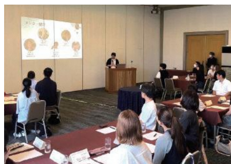
バーベキュー前の企業説明会

今後もさまざまな就活イベントを予定しています。県内就職応援サイト「Nなび」や情報発信サイト「ナガサキエール」で発信していきますので、ぜひチェックしてみてください。