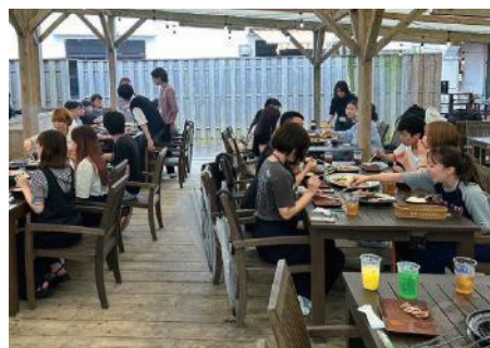
バーベキューでは参加者と企業の担当者が同じテーブルに座り交流