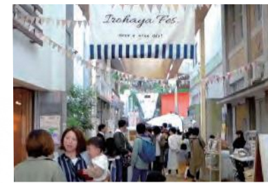
地域がにぎわうSHIMABARA DESIGN ART LABでのイベント風景

1857年に現在の当社がある島原市堀町で足袋屋「いろはや」が創業し、私は5代目にあたります。現在は、婦人服のセレクトショップを島原市で2店舗、長崎市で1店舗、長崎・九州のセレクトおみやげショップを長崎市で2店舗、さらにウェブショップも展開中です。また、島原市のアーケードに人が集い、さまざまな作品の作り手とお客様がつながる場として「SHIMABARA DESIGN ART LAB」を運営しています。