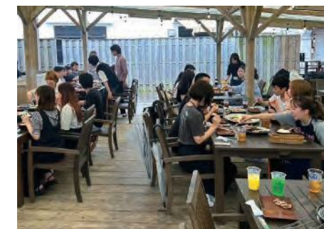
バーベキューでは参加者と企業の担当者が同じテーブルに座り交流