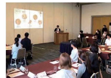
バーベキュー前の企業説明会

今後もさまざまな就活イベントを予定しています。県内就職応援サイト「Nなび」や情報発信サイト「ナガサキエール」で発信していきますので、ぜひチェックしてみてください。