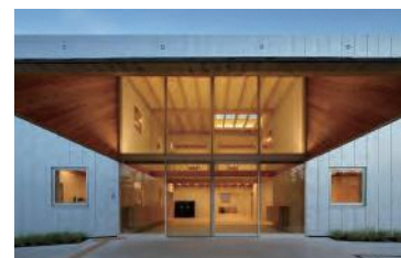
県産木材を使用した社会福祉施設の例

※木造化:建築物の構造上主要な部分に木材を用いること 木質化:内装や外壁などに木材を用いること