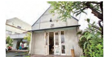
2015年に島原市郊外にオープンした婦人服のセレクトショップ「20-twenty-」