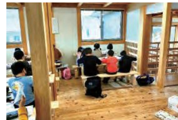
学童保育施設の木質化