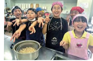
「Soyぎい」での活動風景

杉谷は豊かな自然に恵まれ、野菜・畜産など農業が盛んな地域です。雲仙普賢岳噴火災害で被害を受けた小学校や公民館などはきれいに建て替えられ、国道沿いには商業施設も立ち並んでいます。田舎は不便だと思われがちですが、いざ暮らしてみると意外と便利です。学生の頃は、島原は何も無いと思っていましたが、京都の人から「山も海もあって、食べ物もおいしくてうらやましい」と言われることがあり、少しずつふるさとの良さを実感するようになりました。