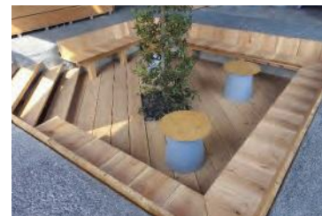
交流施設での木材家具導入