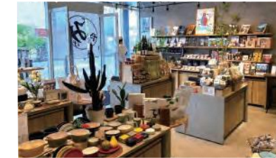
長崎市出島にある「九州みやげ いろはや出島本店」。2022年には長崎駅前に2号店をオープン