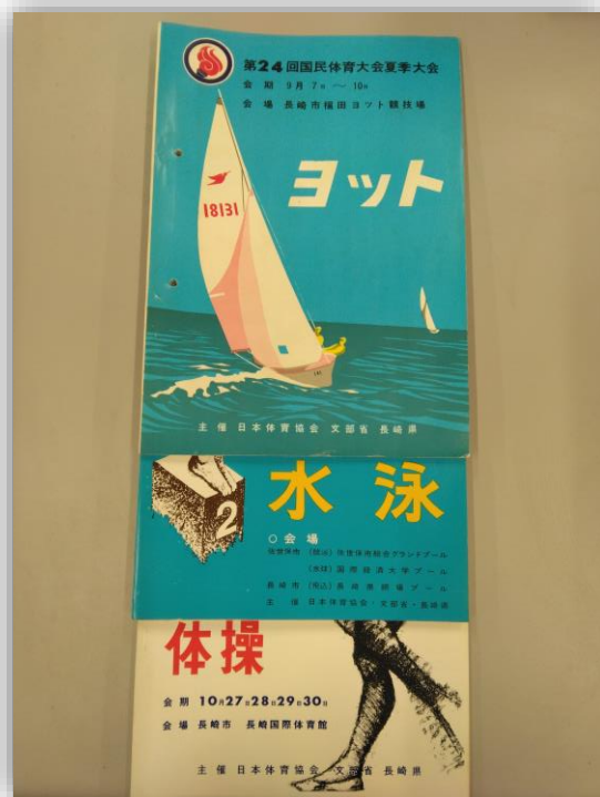
《プログラム(ヨットほか)》