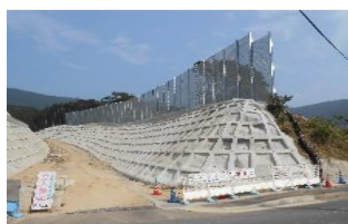
市道内山2号線道路改良工事