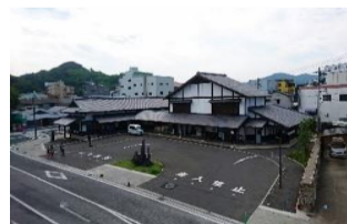
(仮称)観光交流センター新築工事