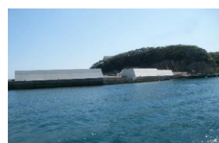
高浜漁港水産生産基盤整備工事