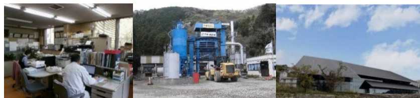
①屋内勤務状況 ②アスファルト合材工場 ③対馬市博物館(仮称)

入社時は普通科卒で、土木のことは全く解からず苦心しましたが、上司や現場の先輩から土木を学び今では、工事を完工した時の達成感とやりがいは人一倍感じる仕事になりました。一諸に働きたい人がいる、頼れる先輩がいる、気の合う人がいるなど、会社を人を選ぶのも大事だと思います。