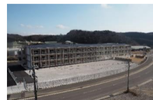
対馬病院職員宿舎・保育所新築工事