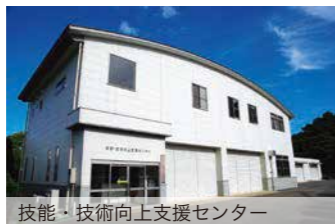
技能・技術向上支援センター