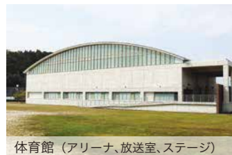
体育館（アリーナ、放送室、ステージ）

A 棟 1 階・2 階：機械加工・制御科 B 棟 1 階・2 階：電気システム科、溶接技術科、配管設備科 C 棟 1 階：建築設計施工科 D 棟 1 階・2 階：自動車整備科、商業デザイン科 共用施設：多目的実習場