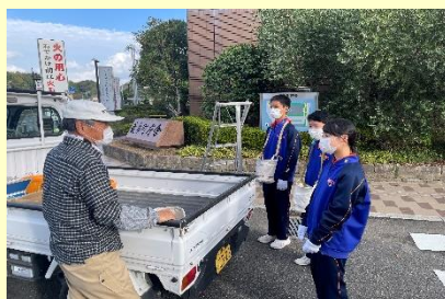
2年 オリーブ収穫体験