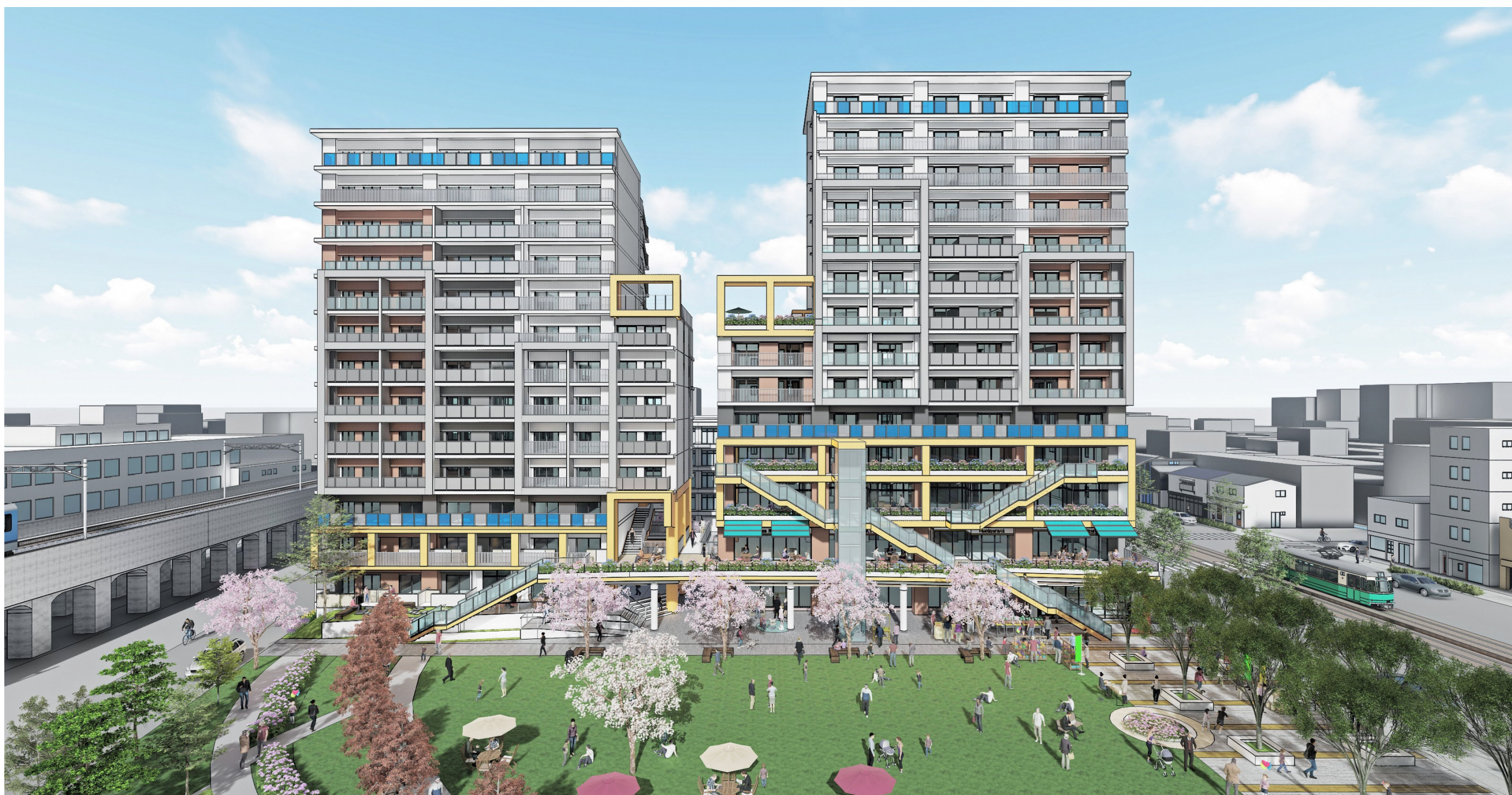
イメージパース(全体鳥瞰)

建替住宅のエントランス、民間施設低層階のエレベーター・階段などの主動線を公園側に重層的に配置し、人の動きを表に向けます。