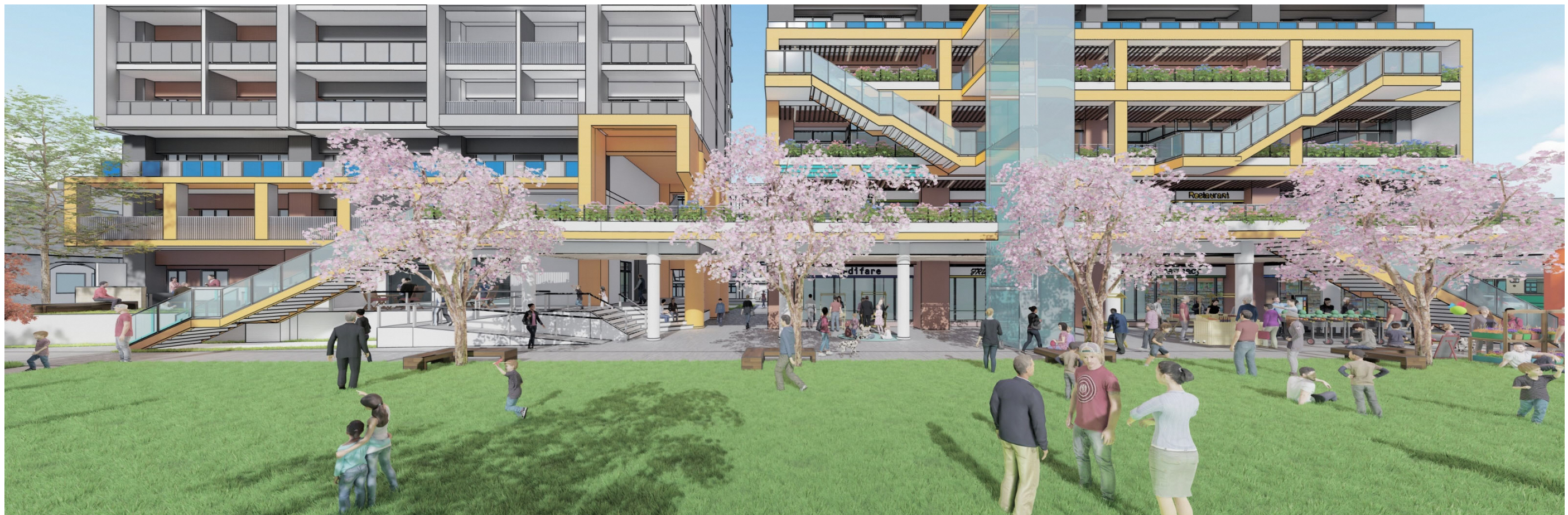
イメージパース(公園側アイレベル)