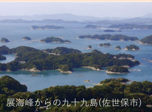
展海峰からの九十九島(佐世保市)